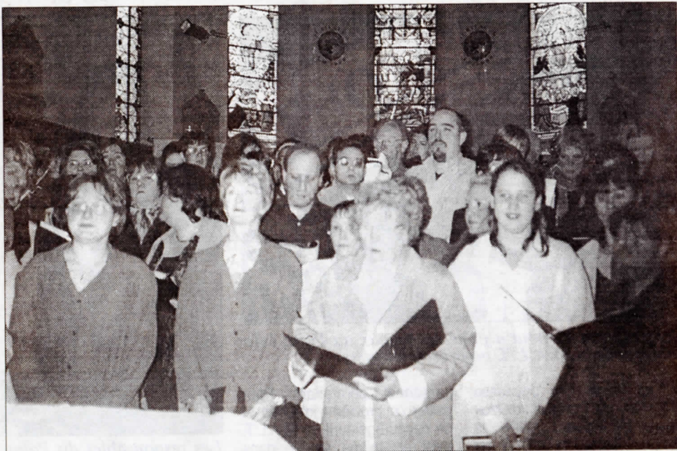
Les chorales de Fontenay, Coulommiers et La Ferté-sous-Jouarre ont participé à ce concert.

A Fontenay-Trésigny, le dimanche 25 mars, trois chorales se réunissaient pour un grand concert dans le cadre de l'opération "Mille chœurs pour un regard". L'association Rétina France soutient la recherche médicale en ophtalmologie et organise, chaque année, une série de concerts au profit des laboratoires.