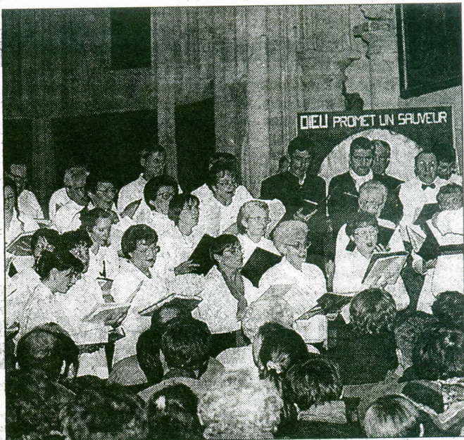
Une assistance nombreuse a apprécié la prestation des chorales.